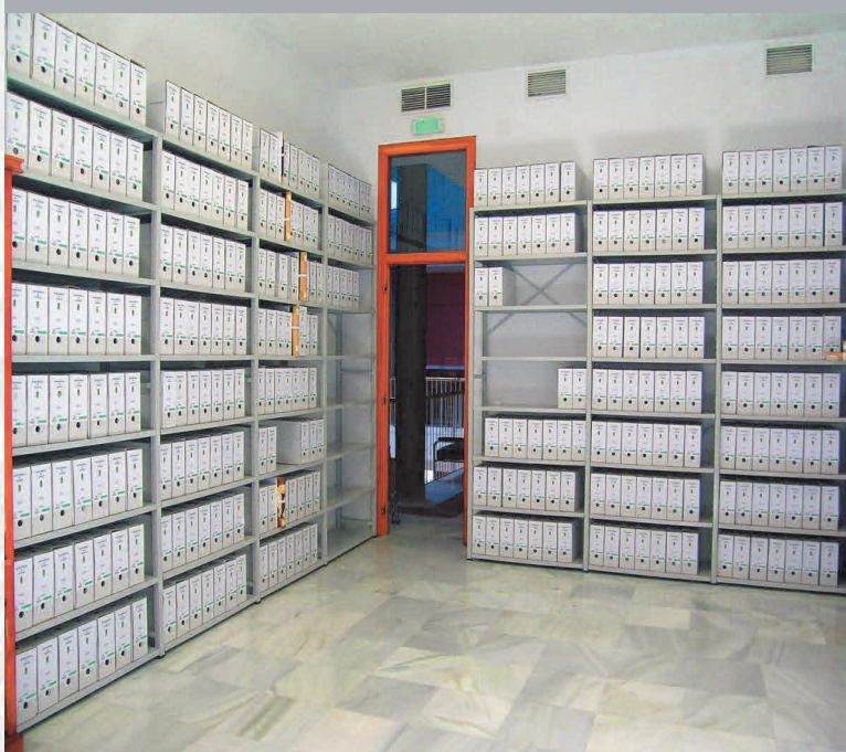
Archivo Municipal de Alconchel después de la elaboración del Inventario.