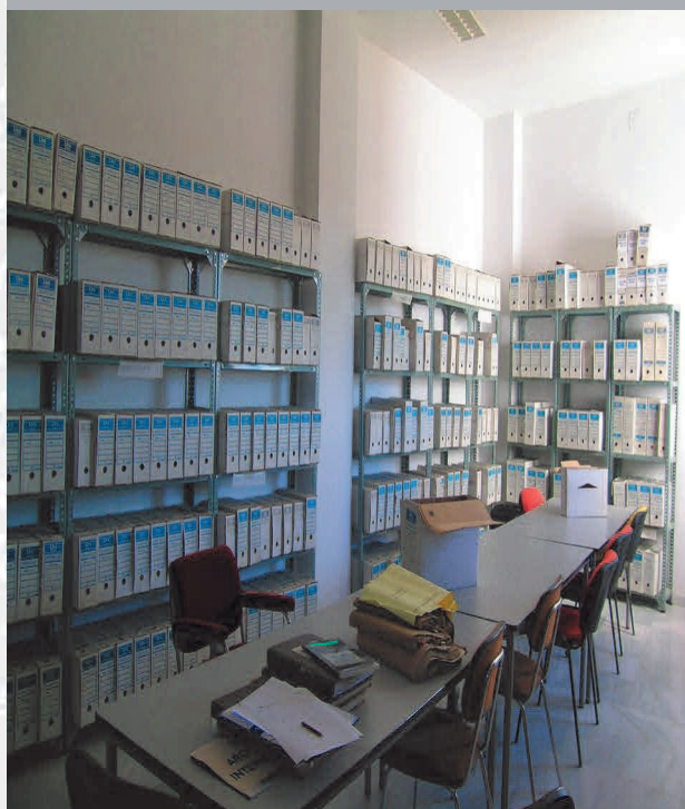
Archivo Municipal de Alconchel antes de la elaboración del Inventario.