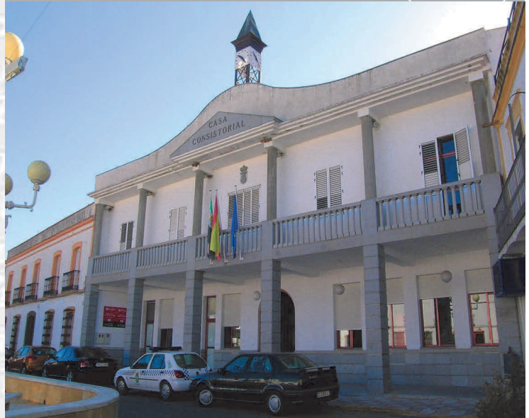
Ayuntamiento de Alconchel