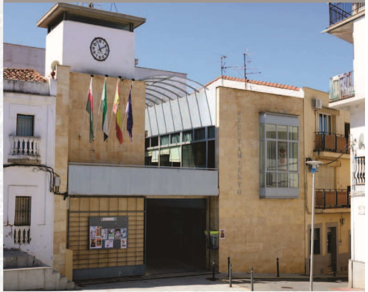
Ayuntamiento de Casas de Don Pedro

ESTREMADURA Por Lopez año de 1700. y por Fuera, por el ucia, y por el Occidente con Allen- incia del Reyno de Portugal. ante a sus, 62. leguas, y Norte por lo mas ancho tertilidad esta Pro- Rios Tago, y Guadiana, viesan por en medio, y chicas, que son el diomon- y el stradilla & Badajoz la, Capital de la Provin- Obispado, y en Puente sobre diano, edificado por los llaza de Guerra, y tiene Castillos, el uno del reynal, y del otro lado erro esta el fuerte de S. Merida, llamada Angu- tivo tiempo linoza de la antigua situa la sobre el Rio Guadiana.