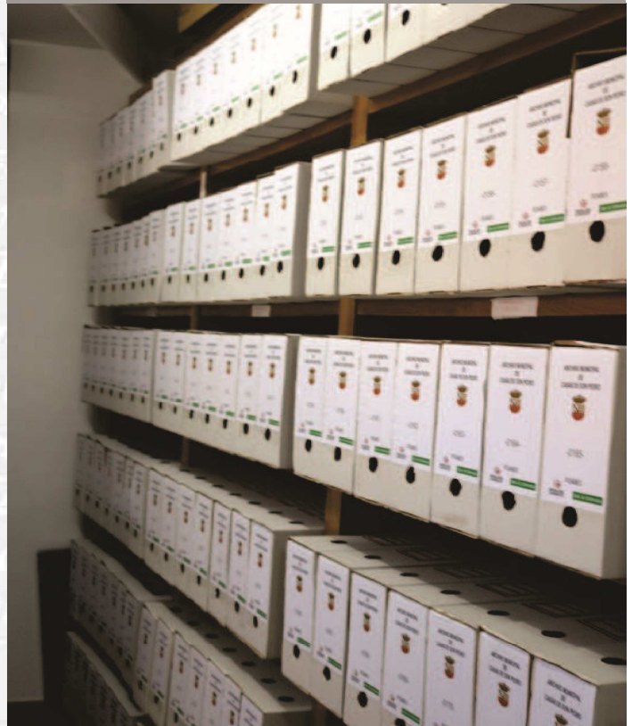
Archivo Municipal de Casas de Don Pedro después de la elaboración del Inventario.