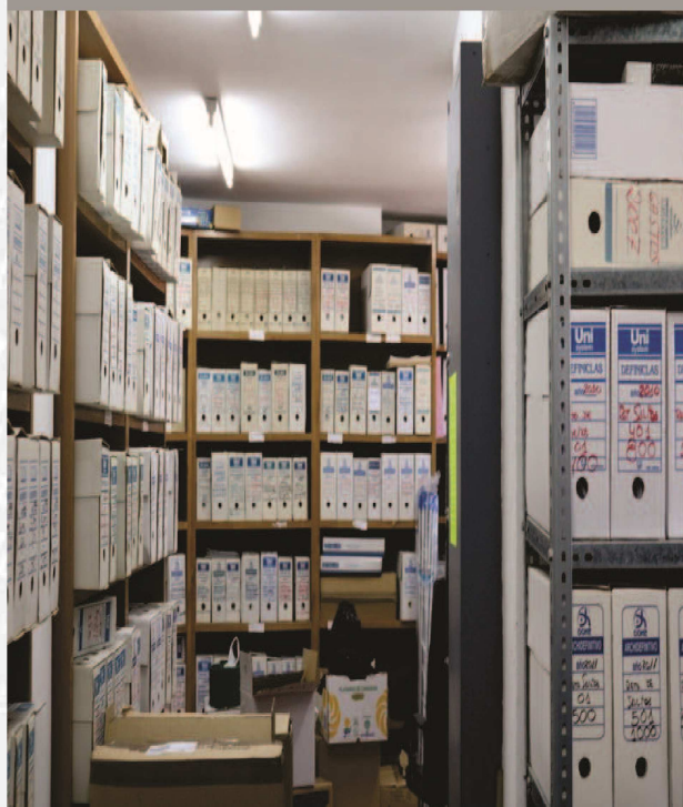
Archivo Municipal de Casas de Don Pedro antes de la elaboración del Inventario.