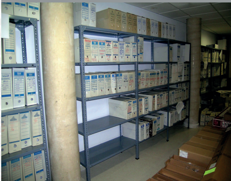
Archivo Municipal de Medellín antes de la elaboración del Inventario.