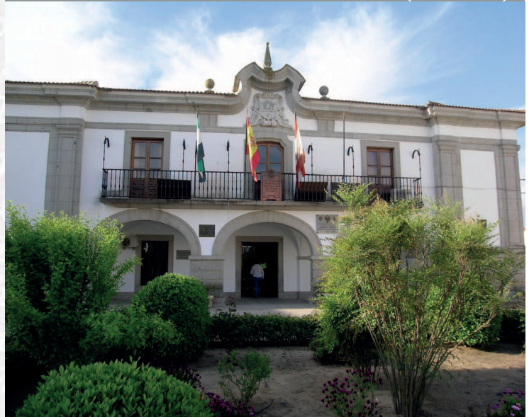
Ayuntamiento de Medellín

STREMADURA Por Lopez año de 1700. y pa Fuera, por el ucia, y por el Occidente con alien- incia del Reyro de Portugal. nte a sus 52. leguas, y Norte por lo mas ancho tertilidad esta Pro- Rios Tago, y Guadiana, viesan por enmedio, y chicas, que son el diomon- y el stradilla & Badajoz la, Capital de la Provin- Obispado, y un Puente sobre diano, edificado por los llaza de Guerra, y tiene Castillos, el uno del rejal, y del otro lado erro esta el fuerte de S. Merida, y en esta Angu- nto tiempo libre de la antigua situa la sobre el Rio Guadiana.